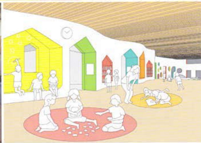
上|中央ホール 下左|改修前 下右|イメージイラスト